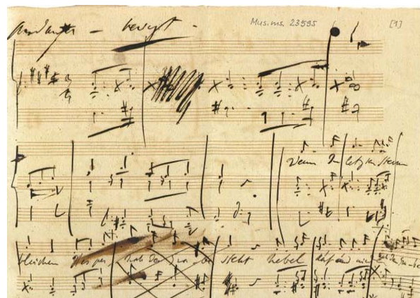
Detail van de pagina

Kort geleden verscheen bij Henle een onlangs in de Beierse Staatsbibliotheek München gevonden lied van Franz Liszt, Wenn die letzten Sternchen bleichen .