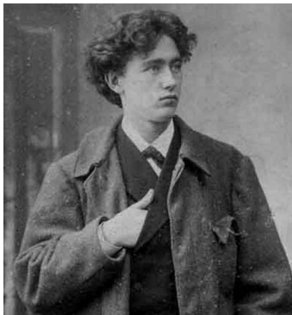
De jeugdige Felix Weingartner.

De Oostenrijker Felix Weingartner (1863– 1942) is vooral nog bekend als een van de grootste dirigenten van omstreeks 1900 en als componist. Minder bekend is dat hij begonnen is als pianist en als muziekstudent tot de laatste leerlingen behoorde die Franz Liszt heeft lesgegeven. Van die lessen heeft hij destijds aantekeningen gemaakt die hij op diverse plaatsen en in diverse vorm gepubliceerd heeft, onder meer in zijn Lebenserinnerungen , die in 1923 in Wenen werden uitgegeven en antiquarisch nog vrij gemakkelijk verkrijgbaar zijn. Onlangs is in de Universiteitsbibliotheek van Basel een manuscript van