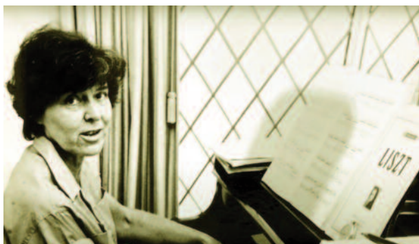
Screenshot uit de film "Heilige werkplicht" van Daniel Brüggén.