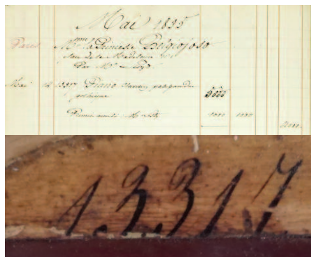
Het bewijs dat vleugel nr. 13317 op 31 mei 1835 na bemiddeling van Liszt aan prinses Cristina de Belgiojoso is geleverd.

Het muziekhistorisch zo belangwekkende instrument was ooit in Amerika beland, maar werd in 2001 gekocht door een Franse pianoverzamelaar. Om de noodzakelijke