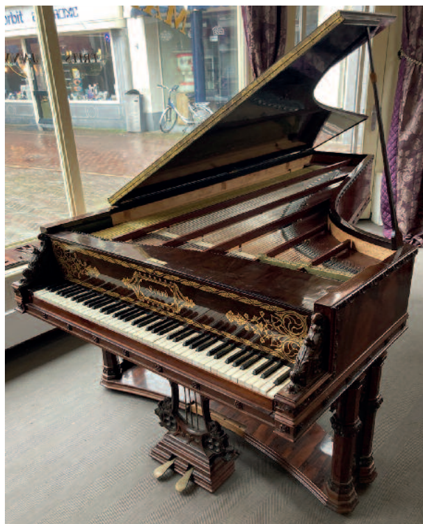
Érard nr. 13317 van Cristina de Belgiojoso tijdens in Maison Érard te Enkhuizen.