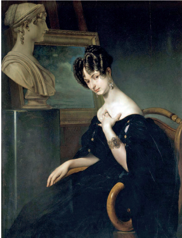
Cristina Trivulzio de Belgiojoso.

Italiaanse prinses Cristina Trivulzio de Belgiojoso, die in het voorjaar van 1837 het initiatief nam, om beide pianisten in haar salon op het klavier te laten duelleren. In haar salon ontving zij vele beroemdheden, onder wie Franz Liszt. Aan hem vroeg de prinses om bij Érard een vleugel voor haar te selecteren, die op haar verzoek een unieke neogotisch bewerkte kast kreeg. In de productieboeken van Erard is het instrument te vinden onder serienummer 13317, gebouwd in 1834 en op 31 mei 1835 verkocht aan Cristina.